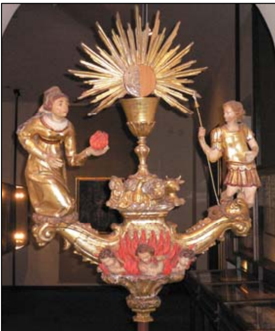
1. Stendardo processionale scolpito nel legno con raffigurazione di Santa Anastasia col fuoco del suo martirio nella mano e San Crisogono. XVIII-XIX secolo

È in modo particolare che Santa Anastasia, martire a Sirmio (Sirmium nel 304), collega anche la diocesi di Djakovo e Srijem (Diacovensius, seu Bosnensis et Sermiensis) come l'arcidiocesi di Zadar, con la città di Roma, dove sotto al Palatino fu eretta una basilica dedicata a essa, nella quale i papi, dai tempi di Gregorio Magno, hanno celebrato la messa mattutina di Natale. Pertanto è una gran gioia per l'Ambasciatore della Repubblica di Croazia presso la Santa Sede poter salutare tutti coloro in Italia che avranno occasione di visitare la mostra dedicata a Santa Anastasia, romana di nascita.